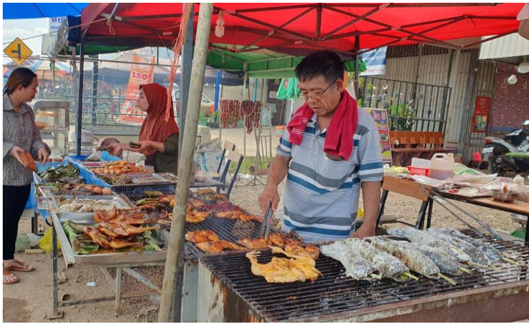
សេវាកម្មម្ហូបអាហារនៅភូមិក្តាវ

នៅក្នុងស្រុកពិសេសនៅថ្ងៃបុណ្យចូលឆ្នាំខ្មែរ ប្រពៃណីជាតិ គណៈកម្មការអាចារ្យវត្តបាន បង្កើតកម្មវិធីលេងល្បែងប្រជាប្រិយជាច្រើនមុខ ដើម្បីឱ្យកម្មវិធីកាន់តែអធិកអធម។