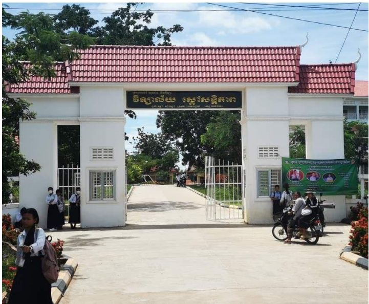
វិទ្យាល័យ ស្ពៅសន្តិភាព

រហូតមកដល់ឆ្នាំ២០២៣ស្រុករតនមណ្ឌលមានសាលារៀនចំនួន៦៧ ថ្នាក់រៀន៤០៩ ចំនួនសិស្សសរុប ១១៧៦៩នាក់ ស្រី៥៨៨២នាក់ ចំនួនគ្រូសរុប៦៥៤នាក់និងអ្នកគ្រូចំនួន៣៦៦នាក់ 11 ។