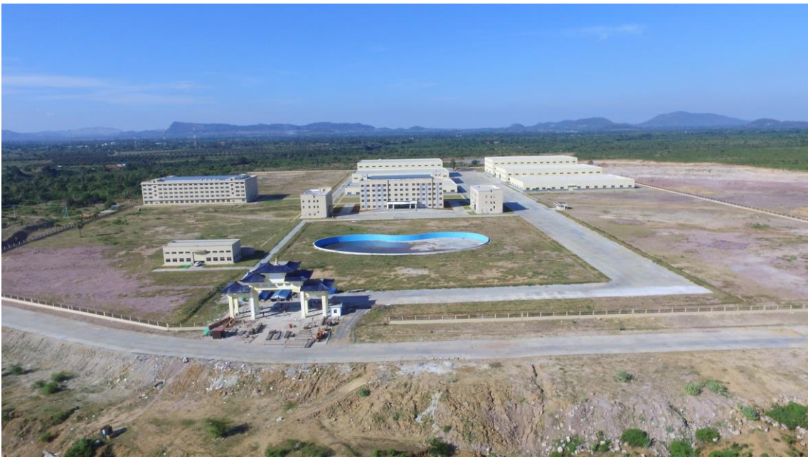
ក្រុមហ៊ុនផលិតសំបកឱសថដែលធ្វើអំពីដំឡូងមី