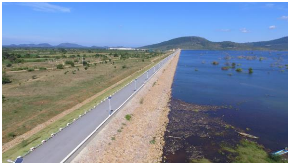
ទំនប់ពហុបំណង(សេកសក)