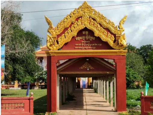
វត្តត្រែង

វិស័យសិក្សាធិការមាន តួនាទីសំខាន់ ណាស់ក្នុងការបណ្តុះធនធានមនុស្ស ដើម្បីកុំឱ្យ កូនចៅប្រជាពលរដ្ឋជួបប្រទះនូវអន្តរាគមន៍ ក្នុងវិស័យសិក្សាធិការនេះ ស្រុករតនមណ្ឌល មានតាំងពីកម្រិតមតេយ្យរសិក្សាហូតដល់វិទ្យា ល័យ។ ដូច្នេះ យើងឃើញថាសាលារៀននៅ ស្រុករតនមណ្ឌល គឺមានសឹងគ្រប់ កូមិ ឃុំ របស់ ស្រុក។ ឯទីតាំងការិយាល័យអប់រំយុវជននិង កីឡាស្រុក គឺស្ថិតនៅទីប្រជុំជនឃុំស្ពៅ។ តារាង ស្ថិតិសិស្សនិងថ្នាក់រៀននៅស្រុករតនមណ្ឌល ១១ ។