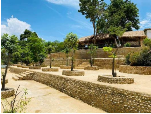
រមណីយដ្ឋានចម្ការទុរេនអូរតង