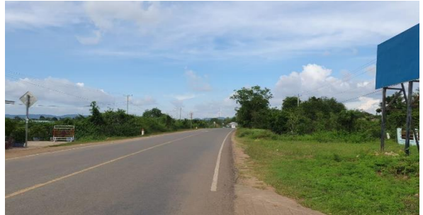
ហេដ្ឋារចនាសម្ព័ន្ធក្នុងស្រុក

ធ្វើឱ្យមានការទាក់ទាញ គយគន់ពី សំណាក់ភ្ញៀវទេសចរ។