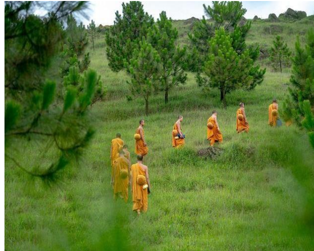
រូបទី១៖ សហគមន៍សង្ឃនិមន្តបិណ្ឌបាត

សព្វថ្ងៃ នៅខណៈពេលដែលព្រះពុទ្ធសាសនា បានរីកសាយភាយទៅកាន់បច្ចិមលោក ពាក្យថាសង្ឃនេះ បានក្លាយទៅជាពាក្យដែលគេប្រើប្រាស់យ៉ាងទូលាយសម្រាប់សហគមន៍អ្នកបដិបត្តិព្រះពុទ្ធសាសនា ឬសូម្បីតែក្រុមអ្នកបដិបត្តិមួយក្រុមតូចនៅតាមមជ្ឈមណ្ឌលព្រះធម៌ ក៏គេរួមគ្នាបង្កើតសហគមន៍សង្ឃឡើងដែរ (រូបទី១)។