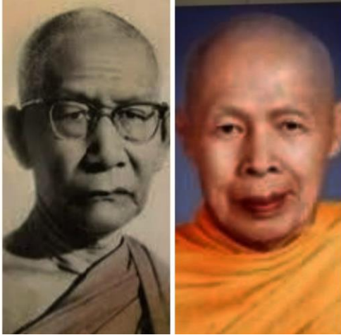
រូបទី៦៖ សម្តេច ជួន ណាត និងសម្តេច ហួតតាត