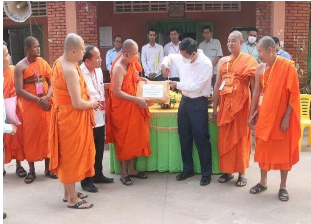
រូបទី៥៖ កាត់វិញ្ញាសាក្នុងការប្រឡងចូលរៀនពុទ្ធិកអនុវិទ្យាល័យទូទាំងខេត្តកណ្តាលនៅព្រឹកថ្ងៃទី៩ ខែមីនា ឆ្នាំ២០២៣

ទស្សនវិជ្ជា អក្សរសាស្ត្រខ្មែរ និងព័ត៌មានវិទ្យា។ ដោយសារពុទ្ធិកសាកលវិទ្យាល័យទាំងពីរខាងលើ មានផ្តល់កម្មវិធីអាហារូបករណ៍ច្រើនជួយដល់សមណនិស្សិត និងនិស្សិតទូទៅដែលពុំមានលទ្ធភាពគ្រប់គ្រាន់ សម្រាប់បង់ថ្លៃសិក្សានាំឱ្យមានចំនួនសមណនិស្សិត និងនិស្សិតទូទៅជាច្រើនរស់នៅតាមបណ្តាខេត្តនានា សំដៅមកសិក្សានៅពុទ្ធិកសាកលវិទ្យាល័យទាំងពីរនេះ។ នេះសរុបញ្ជាក់ឲ្យឃើញថាកម្ពុជាបច្ចុប្បន្នការបណ្តុះបណ្តាលសង្ឃគឺមានយុទ្ធសាស្ត្រ មានកម្មវិធី មានផែនការ និងគោលនយោបាយអប់រំត្រឹមត្រូវ ព្រោះព្រះពុទ្ធសាសនា ជាសាសនារបស់រដ្ឋ។