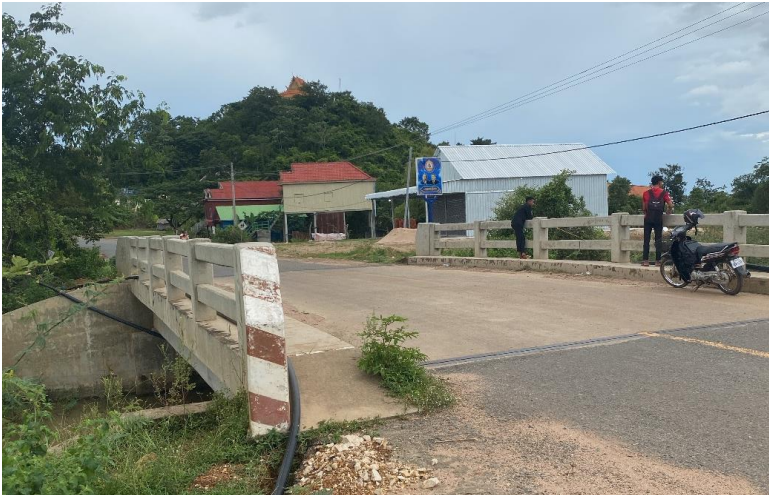
រូបលេខ២៖ ភ្នំតាតុំ និង ស្ពានសង់ឆ្លងកាត់អូរលង់

ទៅណា ក៏ដើរមកតាម។ យាយដើរមកតាមក៏ឃើញប្តីស្លាប់ ចំណែកដំរីក៏ស្លាប់ដែរ។ ពេលឃើញបែបនេះ យាយយំសោកសង្រែង ឆ្លងទឹកក៏អង្គុចព្រោះទៅមករាល់ដងបានដំរីជិះឆ្លង ដោយសារទឹកអូរជ្រៅពេក។ ពេលដែលគាត់យំសោកសង្រែង យាយក៏ស្លាប់នៅទីនោះដែរ រួចក៏កើតចេញជាឈ្មោះអ្នកតាមួយឈ្មោះថា យាយតិសង្រែង។ តាមពិតទៅ យាយតិយំសោកសង្រែង បានដាក់ថាយាយតិ សង្រែង (ជាឈ្មោះអ្នកតា)។ ចំពោះអូរលង់គឺដំរីលង់ទឹកស្លាប់នៅក្នុងអូរ។ ចំពោះភ្នំតាតុំក៏នៅជាប់នឹងអូរលង់នេះដែរ។ កាលពីមុន មានស្ពានឈើបុរាណមួយឆ្លងកាត់អូរ ដែលគេហៅឈ្មោះថាស្ពានអូរលង់។ នៅពេលថ្មីនេះ ស្ពានអូរលង់ត្រូវបានសាងសង់ជាស្ពាន ឬ មានទំហំធំ ងាយស្រួលក្នុងការធ្វើចរាចរណ៍ទៅមក (រូបលេខ២)។