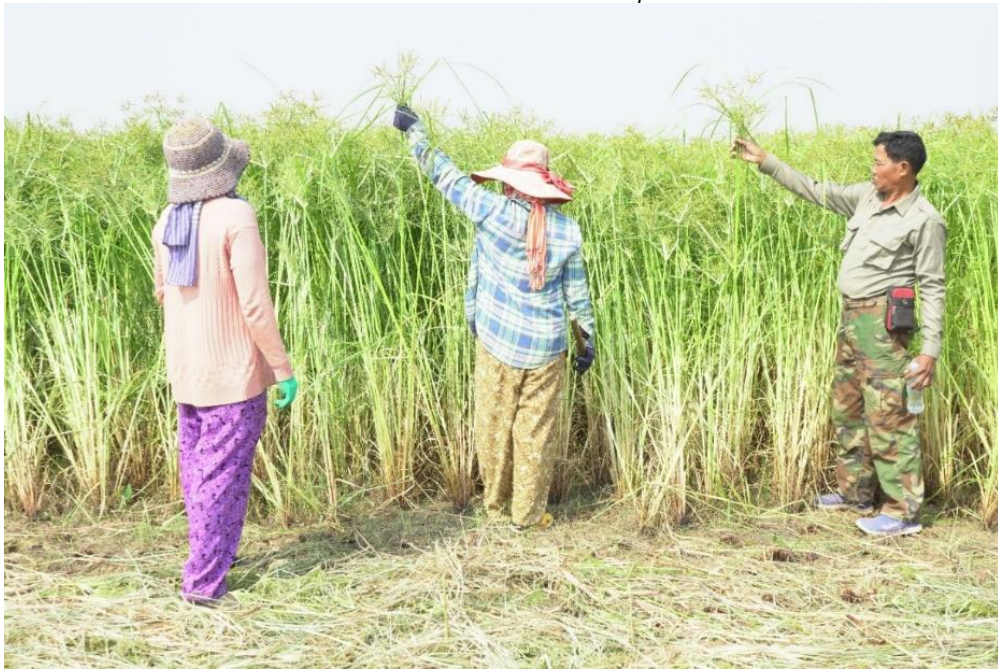
រូបលេខ២៖ សកម្មភាពច្រូកកាត់ដើមកក់សម្រាប់យកទៅត្បាញកន្ទេលកក់