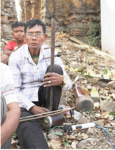
រូបលេខ១២៖ ទ្រ និង ស្ករដៃ