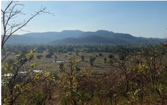
រូបលេខ៥៖ ទិដ្ឋភាពភ្នំទូកមាស មើលពីភ្នំពណ្តារាយ

ភ្នំទូកមាសជាជួរភ្នំវែងជាងគេក្នុងស្រុកកំពង់លែង។ ភ្នំនេះក៏មានរឿងព្រេងនិយាយតន្ត្រីមកថា ពីមុនមកមានអ្នកស្នំធ្វើទូកអំពីមាសយកមកប្រណាំងនៅវាលក្រោមច្រណូក នៅក្រោយភ្នំពណ្តារាយ (រូបលេខ៥)។ ពេលគាត់ត្រឡប់ទៅវិញក៏បាក់ច្រវ៉ាហើយគាត់ទុកច្រវ៉ាចោលនៅទីនេះ ក្រោយមកមានអ្នករកឃើញថា ទូកខូចហើយយកទូកនោះទៅឱ្យជាងធ្វើស្រាប់តែអ្នកស្រុកនាំគ្នាទៅរើសឃើញចំណាំងទូកដែលជាងធ្វើនោះ សុទ្ធតែមាស ទើបដឹងថាទូកនោះជាទូកមាស។ ដូច្នេះក៏ហៅភ្នំនេះថា ភ្នំទូកមាសរហូតមក 13 ។ នៅតែមានការនិយាយតន្ត្រីមកដល់សព្វថ្ងៃថា នៅតែមានអ្នកមានសំណាងអាចរើសបានកម្ទេចមាសដែលបានមកពីការធ្វើទូកមាសនេះ។ មានអ្នកបានឡើងដល់កំពូលភ្នំនេះនិយាយថា នៅកំពូលភ្នំទូកមាសនេះ មានស្រះធំទំហំប្រហែលច្រើនហិកតានៅលើនោះ ដែលអាចប្រណាំងទូកបាន 14 ។