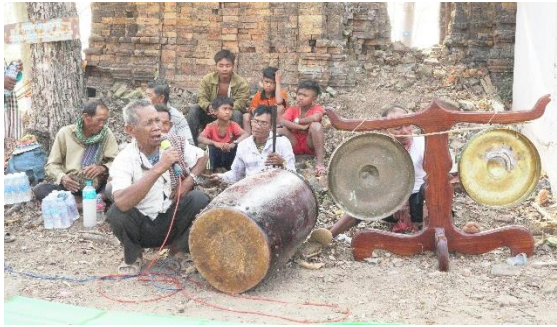
រូបលេខ១៤៖ ភ្លេងប្រគំ អ្នកចម្រៀងចាប់ផ្តើមច្រៀង

ដើរលាបឱ្យអ្នកនៅជិតៗនោះ ជាពិសេសស្រ្តី អ្នករាំគាត់លាបម្សៅឱ្យគ្រប់ៗគ្នា។