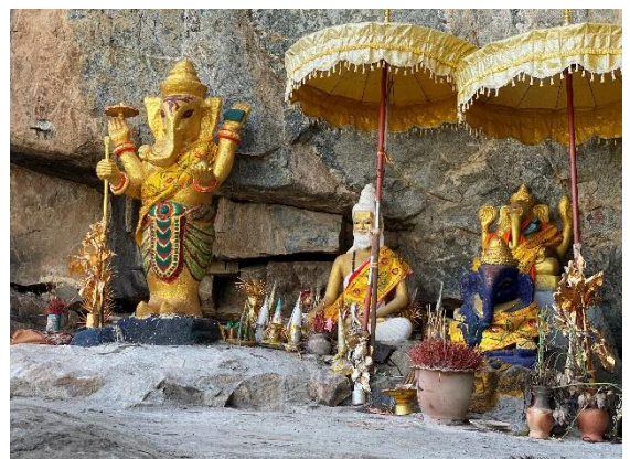
រូបលេខ៦៖ បដិមាព្រះកក្រូតណេសធ្វើពីថ្ម នៅ ចម្រុះភ្នំ

បច្ចុប្បន្ននេះ កក្រូតណេសគឺជា បដិមាធ្វើពីស៊ីម៉ង់ ដែលគេយកទៅតម្កល់នៅ ភ្នំទូកមាស ត្រង់ចម្រុះភ្នំ ស្ថិតនៅទីតាំងភូមិ ជួល ឃុំជា ស្រុកកំពង់លែង (រូបលេខ៦និង ៧)។