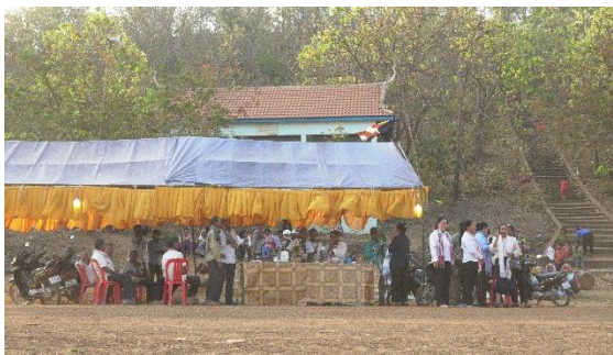
រូបលេខ១៦៖ ទិដ្ឋភាពអ្នករៀបចំពិធីបុណ្យជួបជុំ គ្នានៅរោងក្បែរជើងភ្នំពណ្តារាយ

ពិធីនេះគេធ្វើដល់ម៉ោង៥ល្ងាចទើប ចប់សព្វគ្រប់ រួចនាំគ្នាចុះមកវិញ ហើយគេ នៅបន្តជួបជុំគ្នានៅក្បែរជើងភ្នំពណ្តារាយ រហូតដល់យប់ ហើយមានរបាំទូងស្កររាំកំសាន្ត សប្បាយផង(រូបលេខ១៦)។