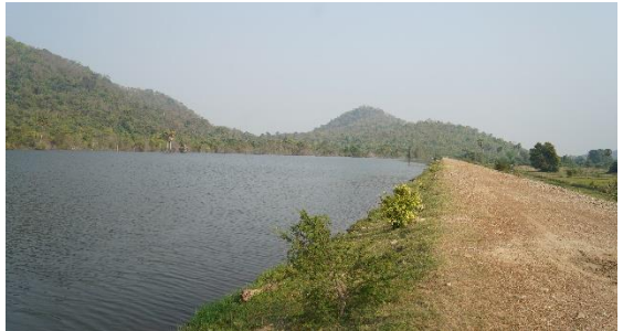
រូបលេខ៨៖ ទីតាំងប្រកបាក់ដាវ

ប្រកបាក់ដាវគឺជាទីតាំងជ្រលងភ្នំ នាងក្រៀម ដែលមានរឿងដំណាលថា គេដោយ យីតបានកាប់ដាវរបស់ស្តេចសម្រែឲ្យបាក់ នៅទីនេះទើបហៅថា «ប្រកបាក់ដាវ»។ នៅ ទីតាំងនេះ គេបានសង់មេទឹកជំមួយ (ទំនប់ ទឹក) ស្តាត់ទឹកសម្រាប់ប្រើប្រាស់ (រូបលេខ៨)។