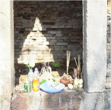
រូបលេខ១០៖ គ្រឿងរណ្តាប់រៀបចំសែននៅក្នុង គូប្រាសាទ