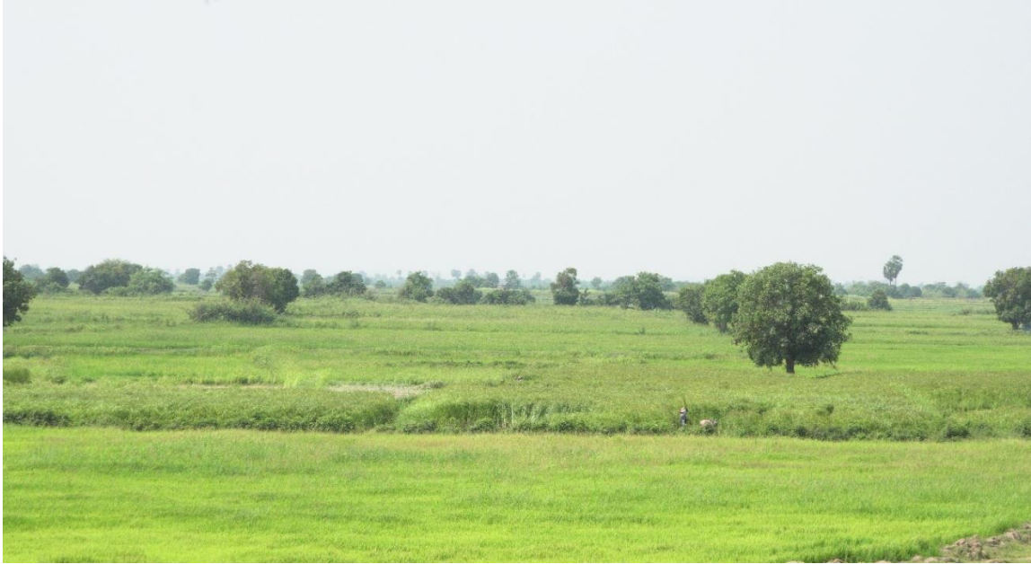
រូបលេខ១៖ ទិដ្ឋភាពវាលស្រែនារដូវប្រាំង ក្នុងស្រុកកំពង់លែង