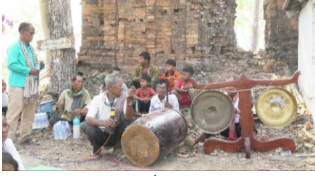
រូបលេខ១១៖ ឧបករណ៍ក្លែងសម្រាប់លេងថ្វាយ

អ្នករាំ និងលេងក្លែង សរុបមានប្រមាណ៣០ នាក់ សុទ្ធតែជាអ្នកភូមិស្រុកនៅម្តុំនេះ (ជា អ្នកភូមិឯលិច និងភូមិកណ្តាល) ដែលបាន ចេះតាមក។ ឧបករណ៍ក្លែងមាន៖ គង់(២) សួរធំ(១) ទ្រ(១) សួរដៃ(៣) អ្នកច្រៀង២ (ប្រុសទាំងពីរ) (រូបលេខ១១និង១២)។ បទចំ រៀងដែលយកមកច្រៀង និងលេងថ្វាយ មានបទស្តេចយាង បទស្តេចផ្ទុំ បទជំនោរ បទឈឺតមន(ជើតមន) និងបទអុំទូក។ ចំណែកទំនុកច្រៀង គឺអ្នកច្រៀងតាមនឹក ឃើញ អង្វករប្បអន្ទង់តាមកាលទេស។