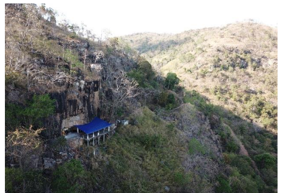
រូបលេខ៧៖ ទីតាំងចម្រុះភ្នំដែលតម្កល់បដិមា ព្រះកក្រូតណេស