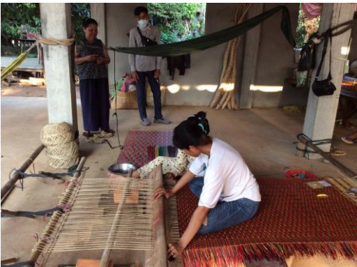
រូបលេខ១៧៖ តម្បាញកន្ទេលកក់ នៅភូមិត្រងីល ឃុំត្រងីល ស្រុកកំពង់លែង

ឃុំត្រងីលគឺជាឃុំដែលមានប្រជាជន ចូលចិត្តប្រកបមុខរបរត្បាញកន្ទេលកក់។ ភូមិក្នុងឃុំត្រងីលដែលនិយមត្បាញកន្ទេល ច្រើនជាងគេគឺភូមិអណ្តូងរនុក។