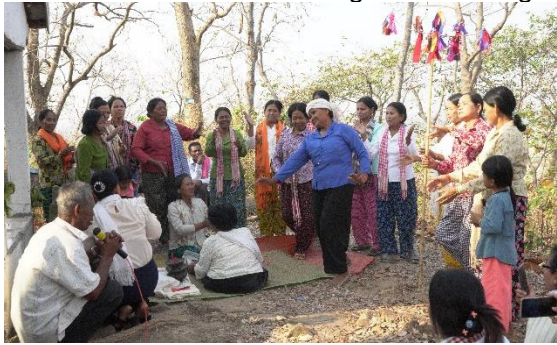
រូបលេខ១៥៖ អ្នកចម្រៀងនិងអ្នកចូលរូបម្នាក់

ពិធីនេះគេធ្វើដល់ម៉ោង៥ល្ងាចទើប ចប់សព្វគ្រប់ រួចនាំគ្នាចុះមកវិញ ហើយគេ នៅបន្តជួបជុំគ្នានៅក្បែរជើងភ្នំពណ្តារាយ រហូតដល់យប់ ហើយមានរបាំទូងស្កររាំកំសាន្ត សប្បាយផង(រូបលេខ១៦)។