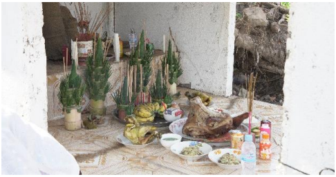
រូបលេខ៧៖ គ្រឿងរណ្តាប់សែនក្នុងខ្នងអ្នកតា

ជង្វាយ មានបាយសី៥ថ្នាក់(១គូ) បាយសី៣ថ្នាក់(១គូ) ទៀន៥ជួប៥ ចំនួន១ កន្លែង(មួយថាស) ប្រដាប់សំណែនមាន ក្បាលជ្រូក(១) មាន់ស្បែក(១គូ) ចេក(១គូ) មានក្រាស កញ្ចក់ ទឹកអប់ ប្រេងម្សៅ (រូប លេខ៧)។ នៅមានគ្រឿងរណ្តាប់រៀបចំសែន ក្នុងគូប្រាសាទមួយកន្លែងទៀត ដែលមាន ស្នាធម៌ដូច ផ្កាឈូក ទានជួប។ សូមជម្រាប ថា គ្រឿងរណ្តាប់គេរៀបនៅលើក្នុងពណ្ណារាយ កន្លែងផ្សេងទៀត គ្រាន់តែសែនព្រេនក្លែង ធម្មតាទេ (រូបលេខ១០)។