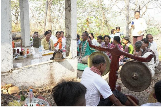
រូបលេខ១៣៖ លោកតាអាចារ្យសូត្រមុននឹងចាប់ផ្តើមកម្មវិធី

នៅវេលាប្រហែលជាម៉ោង៣ទៅម៉ោង៣កន្លះ រសៀល អាចារ្យគណកម្មការ អ្នកស្នងរូប អ្នកភ្លេង អ្នកច្រៀង អ្នករាំ រួមទាំងអ្នកភូមិមានចាស់ក្មេង បានជួបជុំគ្នាឡើងទៅលើភ្នំពណ្ណរាយ ដើម្បីចាប់ផ្តើមរៀបចំកិច្ចពិធី។ ជាដំបូងគេយកគ្រឿងរណ្តាប់ និងដង្ហាយរៀបនៅក្នុងរោងអ្នកតារួចដុតទៀនធូបក្រាបសំពះបួងសួងគ្រប់ៗគ្នា។ អ្នកស្នងរូបអ្នកតា ចាប់ផ្តើមរៀបចំខ្លួននិងគ្រឿងរណ្តាប់ដែលបានដាក់មកតាមខ្លួនជាស្រេច ដែលឃើញមានជើងពានបីថ្នាក់ធ្វើអំពីស្ពាន់ ទឹកអប់ប្រេងម្សៅ ម្សៅស្វាយ អង្កុយនៅចំហៀងបន្តិចលើកន្ទេល។ មានអ្នករាំឈរតំរៀបគ្នារាងកោងនៅខាងក្រោយរូបស្នង ក្នុងសំលៀកបំពាក់សមរម្យដោយមានបង់ក្រមាទម្លាក់មកខាងមុខដូចៗគ្នា (រូបលេខ១១៣)។