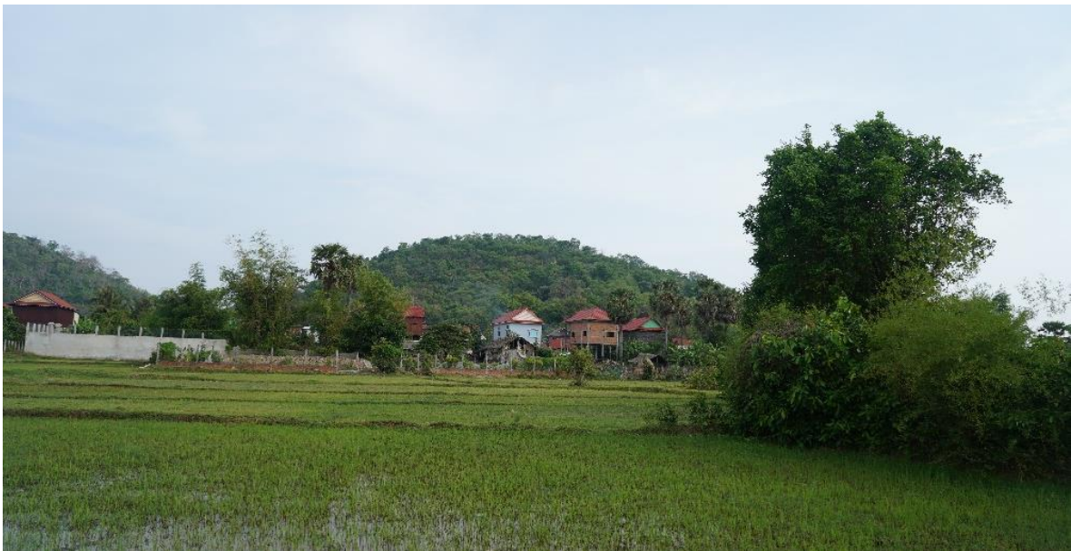
រូបលេខ៣៖ ទិដ្ឋភាពវាលស្រែ ភូមិដ្ឋាន និងភ្នំត្រងីលនៅខាងក្រោយ

ភ្នំត្រងីលស្ថិតក្នុងភូមិត្រងីល ឃុំត្រងីល។ ភ្នំ នេះមិនសូវមានដើមឈើដុះច្រើនទេ (រូប លេខ៣)។ តាមរយៈលោកអ៊ំ នៅ ភិន ដែល ជាចាស់ទុំក្នុងភូមិ បានរៀបរាប់ថា «កាលដើម ឡើយ អ្នកស្រុកនៅឃុំត្រងីល ប្រកបរបរ ត្បាញកន្ទេល ដោយប្រើប្រាស់ត្រល់។ នៅ ពេលប្រើប្រាស់ត្រល់យូរទៅៗ ត្រល់នោះ តែងតែមានការសឹករិចរិលជាបន្តបន្ទាប់។ ដោយមូលហេតុត្រល់នេះរិលនិងសឹករិករិល ទើបអ្នកស្រុកដាក់ឈ្មោះភ្នំនេះថា ភ្នំត្រងីល រហូតដល់សព្វថ្ងៃនេះ» 11 ។