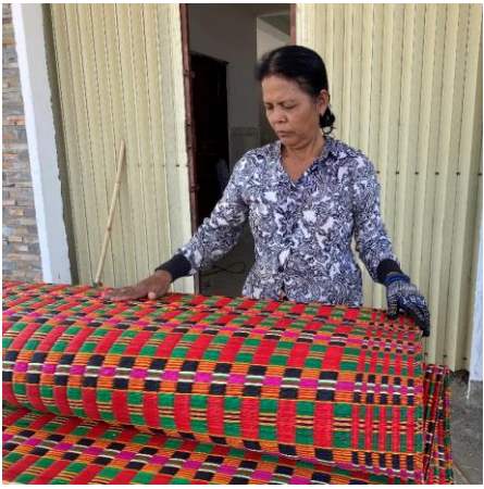
រូបលេខ១៨៖ កន្ទេលកក់ ត្បាញនៅភូមិអណ្តូងរនុក ឃុំត្រងីល ស្រុកកំពង់លែង