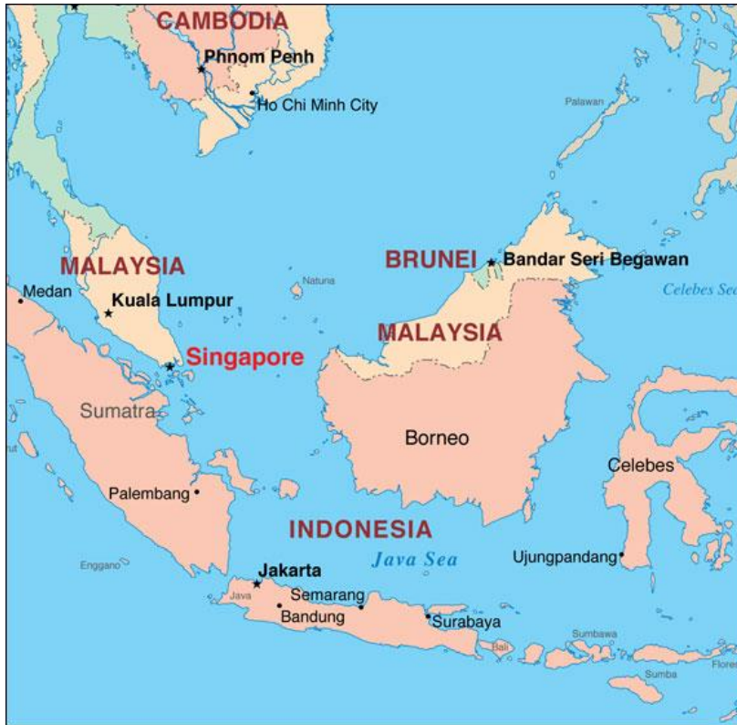
ផ្លូវដឹកជញ្ជូនតាមសមុទ្រ ដែលទាក់ទងទៅនឹងកំពង់ផែនៃប្រទេសសិង្ហបុរី