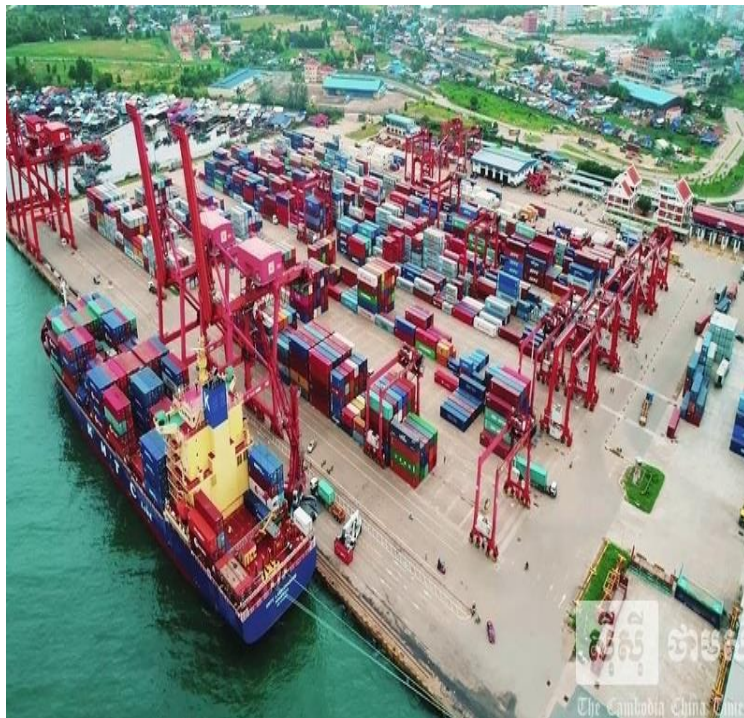
សកម្មភាពលើកដាក់ទំនិញ នៅកំពង់ផែក្រុងព្រះសីហនុ (១)