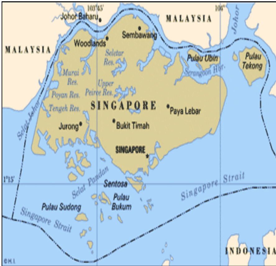
កំពង់ផែរបស់ប្រទេសសិង្ហបុរី