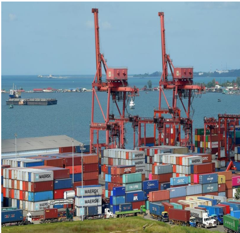
សកម្មភាពលើកដាក់ទំនិញ នៅកំពង់ផែក្រុងព្រះសីហនុ (៣)