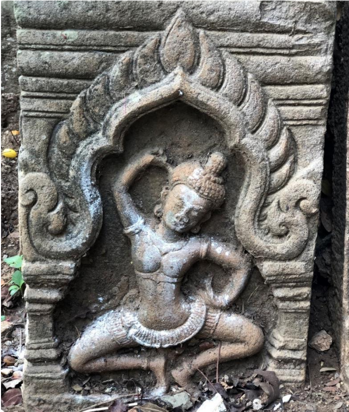
រូបលេខ ៤៖ ចម្លាក់ទេពស្រីនៅលើសសរពេជ្រ ជាប់ទ្វារចូលខាងកើត