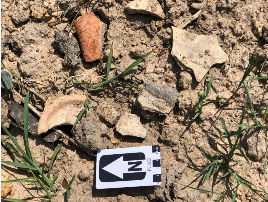
រូបលេខ ១៣៖ បំណែកកុលាលភាជន៍ និងកុណ្ណីមានអាយុកាលក្នុងសម័យមុនអង្គរ (សតវត្សរ៍ទី៥-៦)