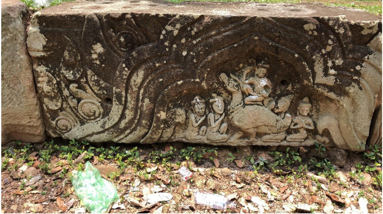
រូបលេខ ៩៖ ហោជាងធ្លាក់រូបព្រះការុណាជិះលើសត្វហង្ស