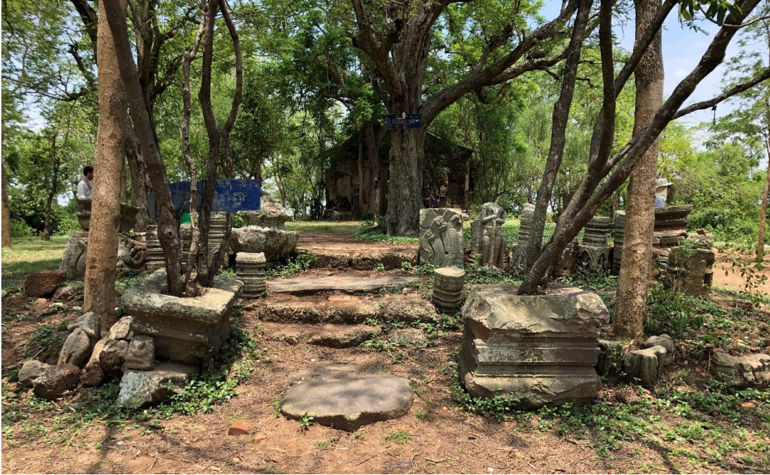
រូបលេខ ៣៖ ផ្លូវរាងចតុកោណកែង មើលពីមុខ