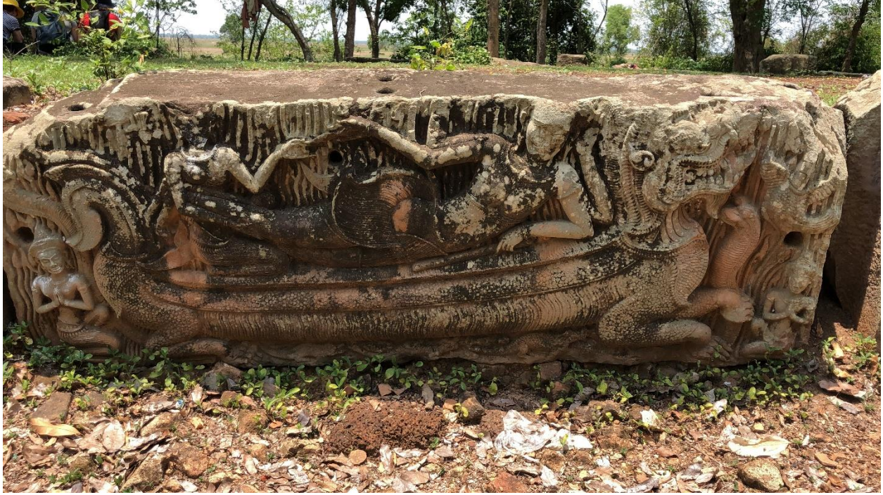
រូបលេខ ៨៖ ផ្តែរព្រះវិស្ណុផ្ទុំលើនាគ