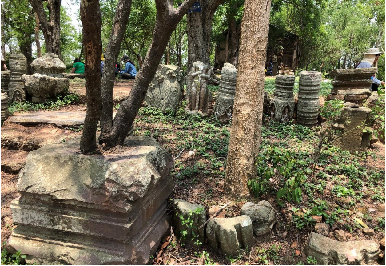
រូបលេខ ១១៖ ចម្លាក់ទ្វារបាល និងនាគ ព្រមទាំងសសរពេជ្រ ជំបូលប្រាសាទ និងទម្រង់ដីមា