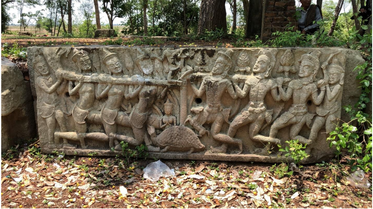
រូបលេខ ៥៖ ផ្តែរកូរសមុទ្រទឹកដោះ