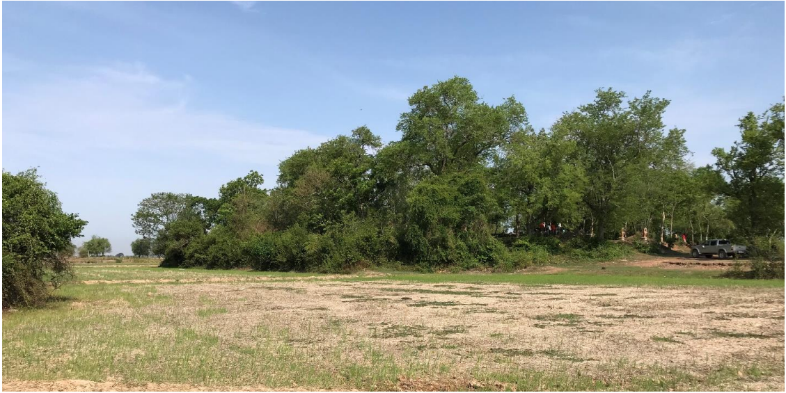
រូបលេខ ១៖ ប្រាសាទព្រះធាតុបារាយណ៍មានគូទឹកព័ទ្ធជុំវិញ