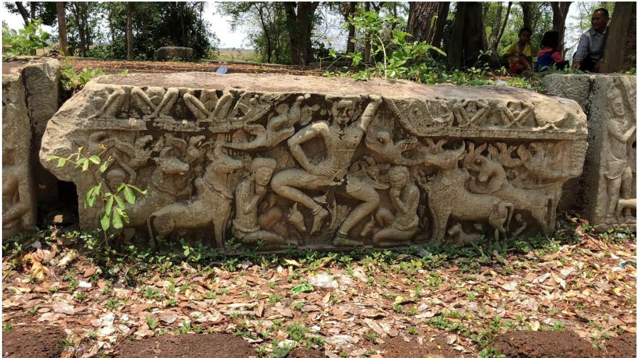
រូបលេខ ៦៖ ផ្តែរព្រះគ្រីស្ទៈទ្រង់