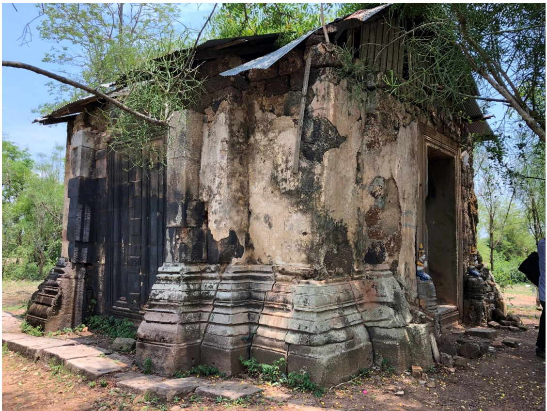
រូបលេខ ២៖ គូប្រាសាទព្រះធាតុបារាយណ៍