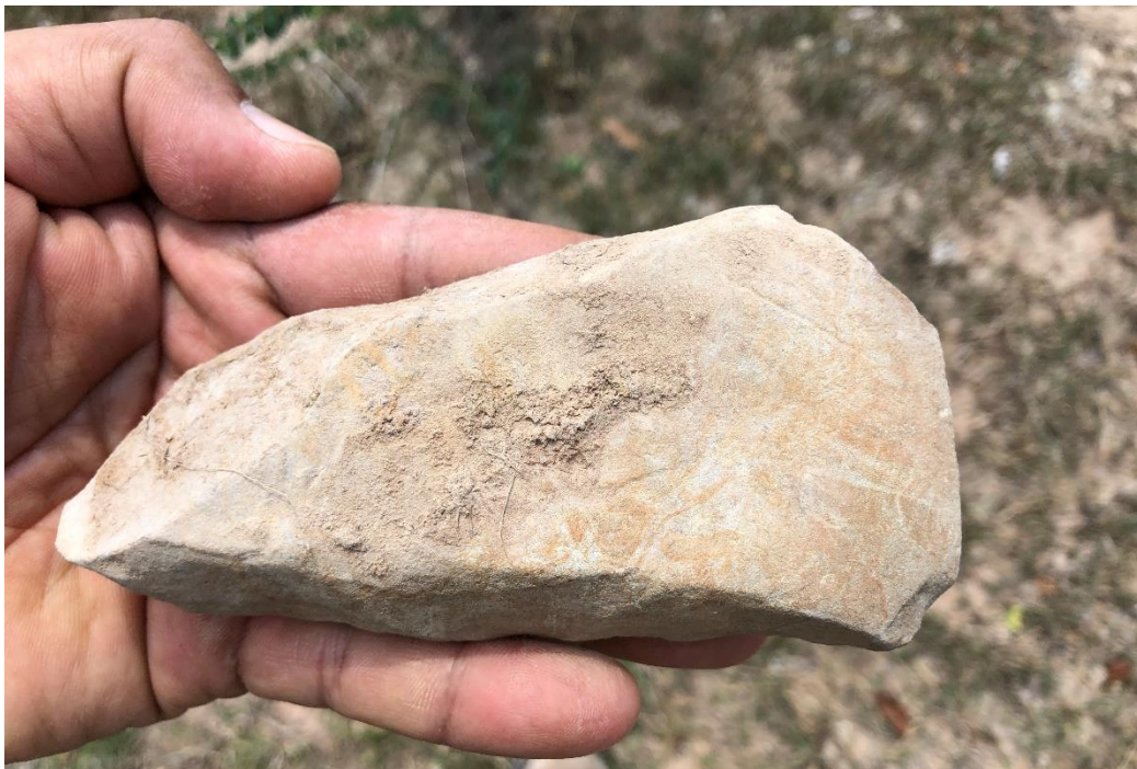
រូបលេខ ១២៖ ឧបករណ៍ថ្មមានអាយុកាលក្នុងយុគថ្មរំលីង