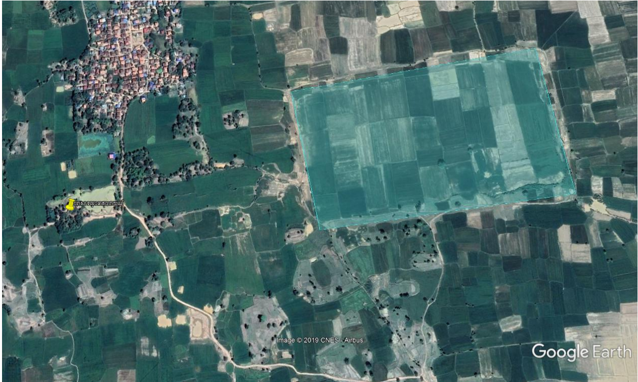
ផែនទីលេខ ២៖ ផែនទីប្រាសាទព្រះធាតុបាយណ៍ និងបាយណ៍ ដែលអ្នកស្រុកហៅថា «ស្រែបឹង»