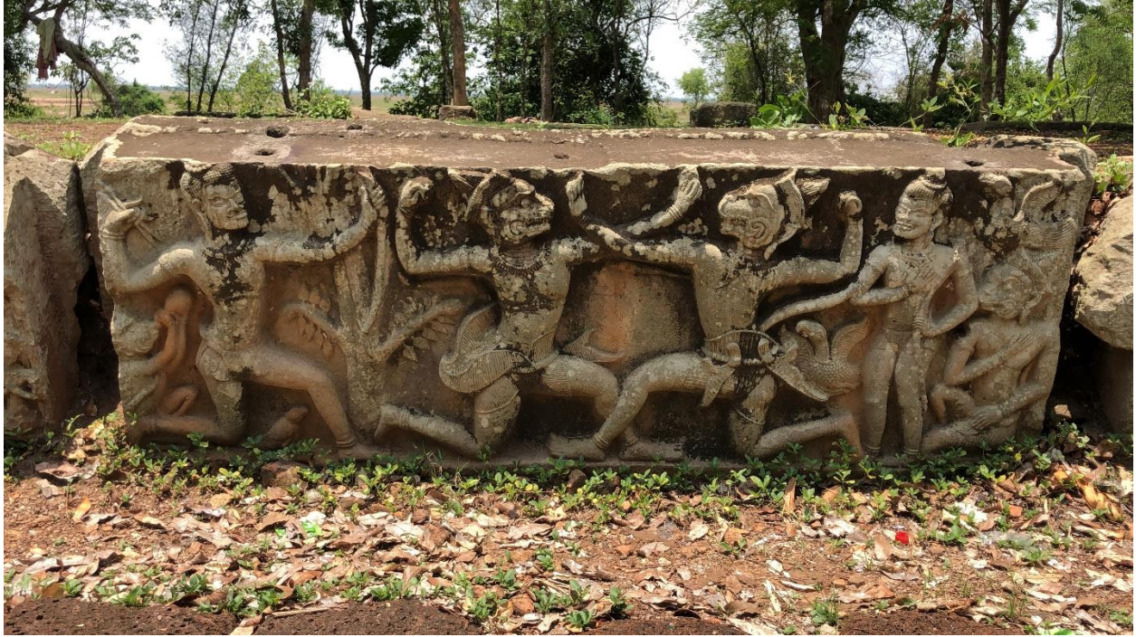
រូបលេខ ៧៖ ផ្តែររឿងរាមកេរ្តិ៍