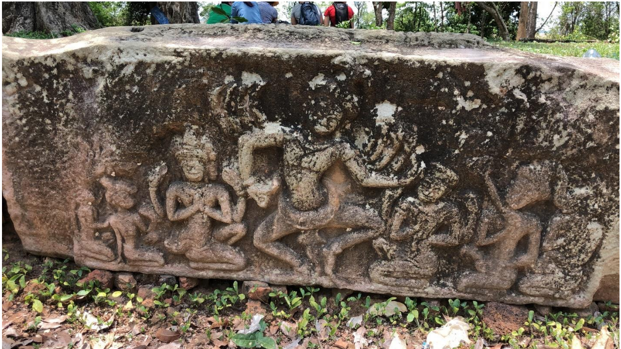
រូបលេខ ១០៖ ផ្តែរព្រះឥសូររាំ ព្រះព្រហ្ម និងព្រះវិស្ណុ