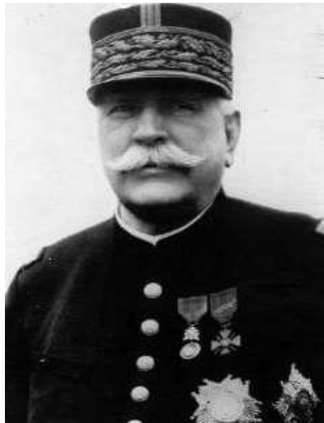
លោកសេនាប្រមុខ Joseph Joffre (១៨៥២-១៩៣១) បានកាន់តំណែងជាអគ្គបញ្ជាការកងទ័ពបារាំង នៅរណសិរ្សខាងលិច ពីពេលចាប់ផ្តើមសង្គ្រាមលោកលើកទី១ដល់ដំណាច់ឆ្នាំ១៩១៦ 8 ។

ការអាណាព្យាបាលបារាំង ដែលរក្សាបាននូវស្ថេរភាពក្នុងសង្គមកម្ពុជានាសម័យនោះ។ នៅក្នុងវេលាដែលបារាំងកំពុងច្បាំងនោះ ទាហានបារាំងទាំងប៉ុន្មានត្រូវយកចេញពីរោងទាហាន 5 ទៅស្ងាត់អស់។ បារាំងគ្មានអ្វីនឹងបង្ការឱ្យបានសេចក្តីរក្សាមក្សានុក្នុងស្រុកសោះឡើយ គឺបារាំងមានសង្ឃឹមតែសេចក្តីសុចរិតស្មោះត្រង់ពីនគរដែលបារាំងទំនុកបម្រុង ដូចជានគរកម្ពុជាជាដើម។ សេចក្តីសុចរិតទៀងត្រង់របស់ខ្មែរនោះ ត្រូវបានបង្ហាញយ៉ាងច្បាស់ នៅពេលដែលលោកម៉ារេសាល់«សុព» 6 (គឺលោកសេនាប្រមុខសុព) បានដើរឆ្លងកាត់ស្រុកខ្មែរពីជើងទៅត្បូង ពីកើតទៅលិច ពុំចាំបាច់មានមនុស្សជូនតាមផ្លូវឡើយ។ តែការនេះពុំគួរឆ្ងល់អ្វីទេ គ្មិតនគរក្រុងកម្ពុជា ជានគរដែលមានចិត្តគំនិតប្តឹងខ្ពស់ គិតឃើញថាក្នុងវេលាដែលមានកូនចៅទៅច្បាំងតយុទ្ធនឹងស្រុកអាណ្លីម៉ង់នៅក្នុងរូងដី និងនៅកណ្តាលវាលភក់ 7 ក្នុងនគរបារាំងសែសហើយនិងទៅធ្វើជាជាងយកចំណេះកម្លាំងទៅធ្វើការជួយយកអាសាប្រទេសបារាំង បើនាំបង្កើតចលាចលក្នុងទីនោះឡើងនោះទុកជាសេចក្តីក្បត់អាប័ឱនខ្លាំងណាស់(ខ្លឹមសារដើម)។